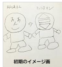
初期のイメージ画

伊 最初に私が描いた絵を見ていただければ分かる通り(笑) 皆で意見を出し合って、何度も何度も何度も修正しながら、やっと完成したんですよ。