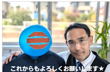
これからもよろしくお願いします★

伊 こちらこそ、ありがとうございました。私もアンシアマンと話ができて良かったです！