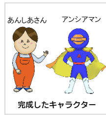
完成したキャラクター

ア きれいに仕上げてもらえて嬉しいです。ありがとうございます。ところで、会社キャラクターとしての私の役割は何でしょう？